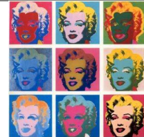
Andy Warhol (1967). Marilyn Monroe