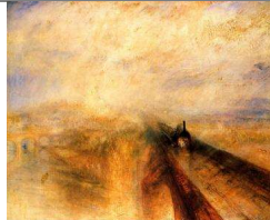
William Turner (1844). Lluvia, vapor y velocidad