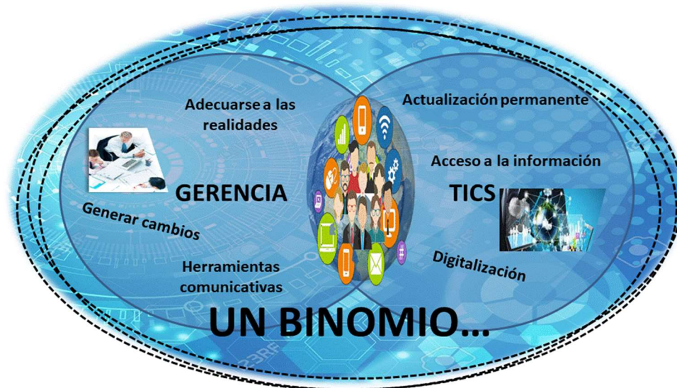
Figura 4: Un binomio: Tics y gerencia.

Se puede decir que la gerencia y el tic, constituyen una especie de binomio, en el que se fusionan diferentes elementos para lograr el éxito de las organizaciones, tal como se presenta en la siguiente imagen: