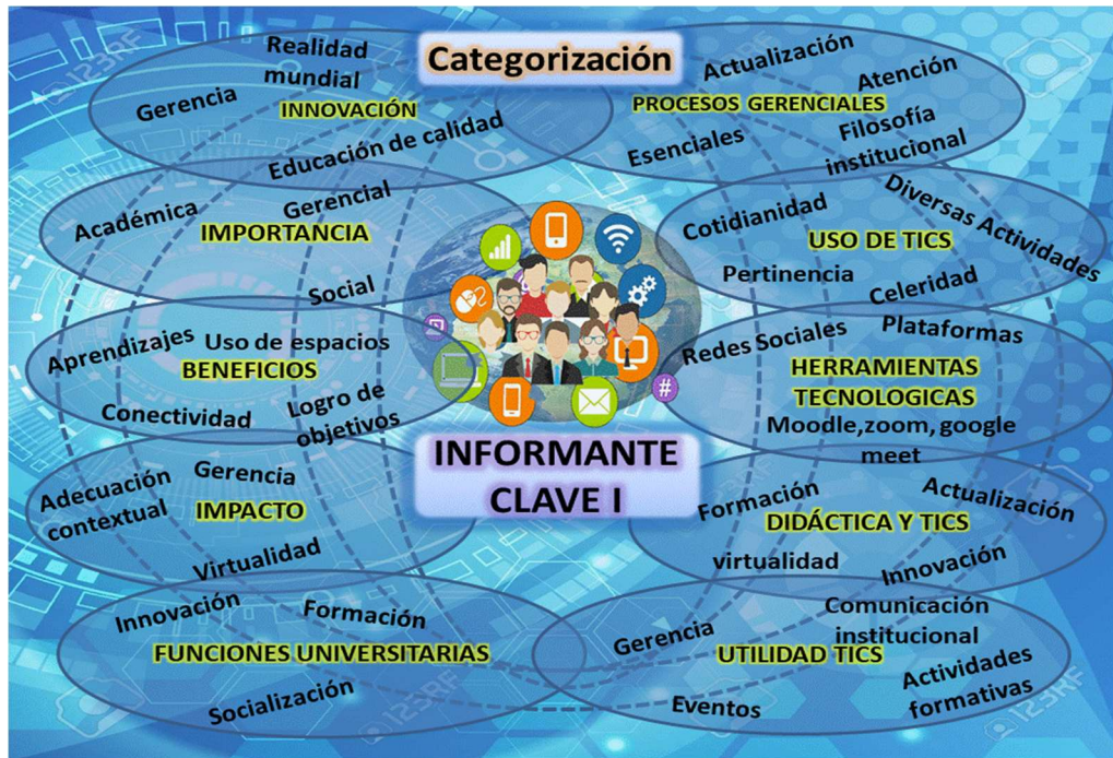
Figura 1: Categorización, Informante clave I.