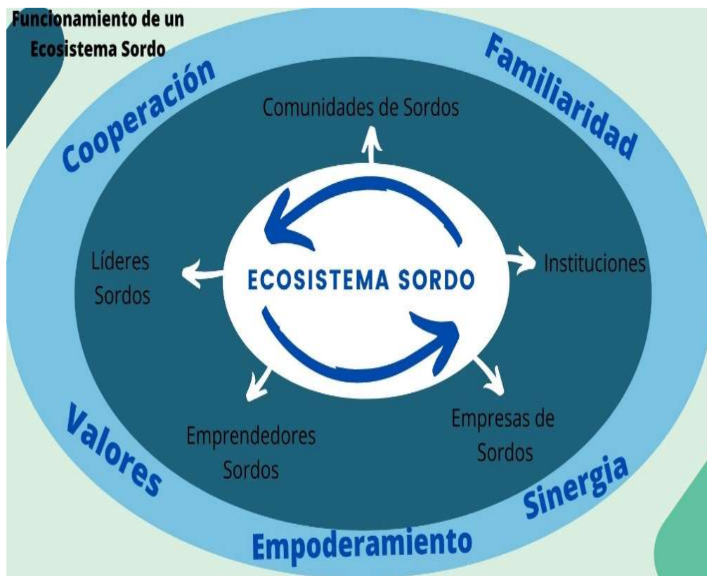
Diagrama funcionamiento de Ecosistema Sordo.